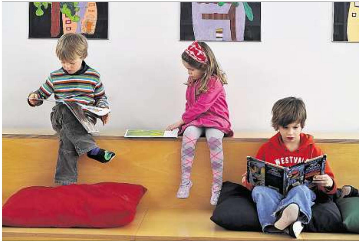
In der Grundstufe wird das selbständige Lernen gefördert. Doch trotz pädagogischer Pluspunkte sind die Kantone skeptisch. Sie fürchten vor allem die Mehrkosten. (Manuela Matt)

zwar am Schulversuch, erprobt die Grundstufe/Basisstufe aber nicht in eigenen Versuchsklassen. Eine Fachkommission, die den Schwyzer Erziehungsrat berät, bevorzugt weder die Grundstufe noch die Basisstufe, sondern schlägt eine andere Variante vor: den «Kindergarten+». In Schwyz soll der traditionelle Kindergarten mit den Kulturtechniken Rechnen, Lesen und Schreiben «angereichert» werden. Auch hier spielen die Kosten eine Rolle: dieses Modell ist billiger als die Einführung einer Grund- oder Basisstufe. Doch die Finanzen dürften nicht der einzige Grund für die ablehnende Haltung sein: Die Grund-/Basisstufe sieht den Schuleintritt mit vier Jahren vor – ein heisses Eisen im Kanton Schwyz, in dem nach wie vor nur ein Jahr Kindergarten obligatorisch ist. Definitiv entschieden wird jedoch auch in Schwyz erst nach Publikation des Schlussberichts über den Schulversuch.